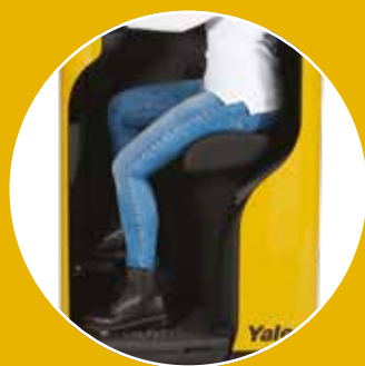
В положении сидя

Сиденье из формованного полиуретана с полностью регулируемой подушкой позволяет оператору управлять работой погрузчика сидя, а также обеспечивает опору, уменьшая усталость при продолжительных перемещениях.